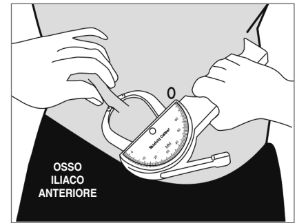
TABELLE PER BAMBINI

Quando si prende la misurazione, il plicometro deve essere orientato a 45 gradi.