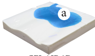
GEL AIR 2D