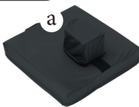
VISCO MOUSS avec BUTEE