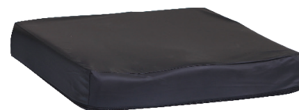
VISCO MOUSS-BULGEL- GEL AIR 2D-3D