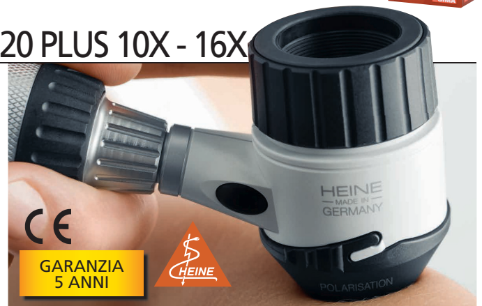
CE GARANZIA 5 ANNI

Indice di resa cromatica. L'indice di resa cromatica o misura quantitativa della precisione del colore è di oltre 87 (IRC) che ne garantisce colori reali. Temperatura di colore: 5.000 Kelvin Gestione termica per una lunga durata. DELTA 20 Plus usa ceramica, una pellicola termoconduttrice e un corpo refrigerante in alluminio in una struttura composita a 3 strati per garantire una luminosità costante per tutta la durata dei led fino a 50.000 ore.