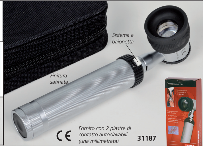
CE Fornito con 2 piastre di contatto autoclavabili (una millimetrata) 31187