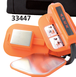
Placche standard per adulti e bambini