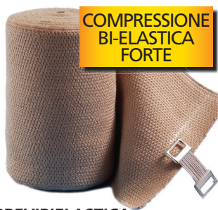
COMPRESSIONE BI-ELASTICA FORTE

PREVIBIELASTICA Bendaggio di sostegno e forte compressione costante , ideale per tutti i problemi relativi al complesso sintomatico varicoso. La caratteristica di possedere estensibilità omnidirezionale la rende particolarmente adatta al bendaggio delle zone articolari.