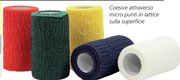
Coesive attraverso micro punti in lattice sulla superficie

*Mix 2 bende x 5 colori (rosso, verde, blu, giallo, bianco)