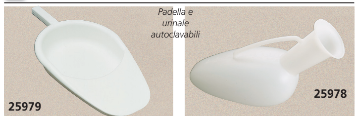
Padella e urinale autoclavabili