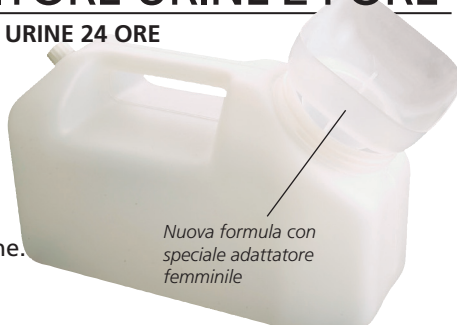
Nuova formula con speciale adattatore femminile

Ogni contenitore è impacchettato singolarmente in una scatola di cartone.