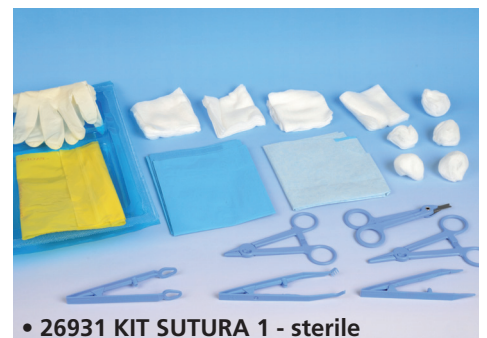
• 26931 KIT SUTURA 1 - sterile