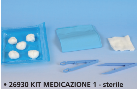
• 26930 KIT MEDICAZIONE 1 - sterile