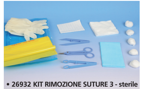
• 26932 KIT RIMOZIONE SUTURE 3 - sterile