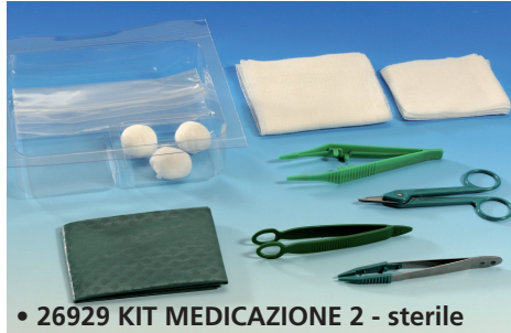
• 26929 KIT MEDICAZIONE 2 - sterile