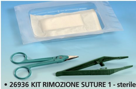
• 26936 KIT RIMOZIONE SUTURE 1 - sterile