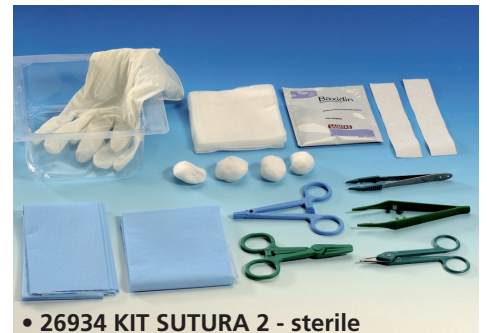
• 26934 KIT SUTURA 2 - sterile