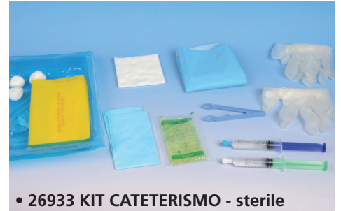
• 26933 KIT CATETERISMO - sterile