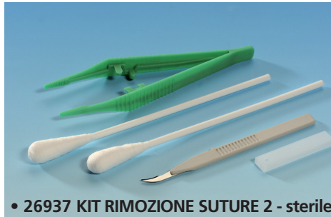
• 26937 KIT RIMOZIONE SUTURE 2 - sterile