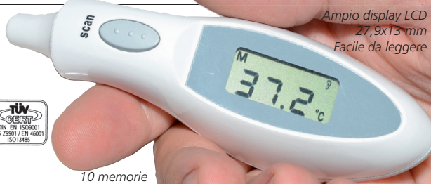
Ampio display LCD 27,9x13 mm Facile da leggere