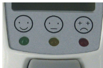
Indicatore febbre a 3 LED