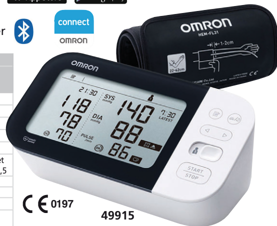
CE 0197 49915

**** Indique si les valeurs dépassent les standards E.H.S. pour l'auto-mesure à domicile (pression systolique 85 et/ou pression diastolique 135) ***** Moyenne des 3 dernières mesures en l'espace de 10 minutes