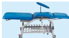
MADE IN ITALY