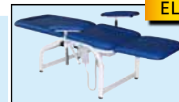
MADE IN ITALY

Struttura verniciata con colore ral bianco 9003, spessore minimo 70/80 micron. Finitura lucida.