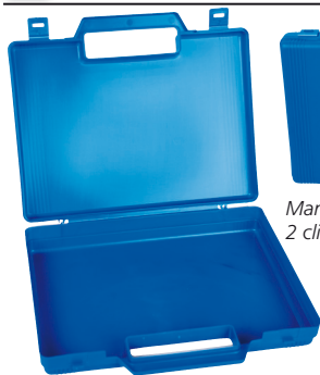
Maniglia per il trasporto, 2 clip di chiusura a scatto