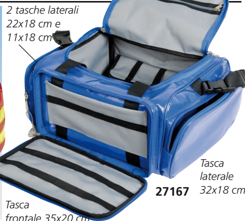
2 tasche laterali 22x18 cm e 11x18 cm