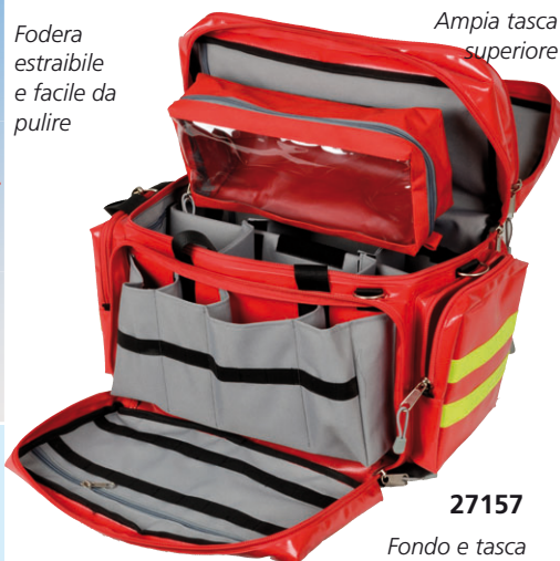
Fodera estraibile e facile da pulire Ampia tasca superiore