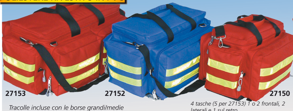
27153 27152 27150 Tracolle incluse con le borse grandi/medie 4 tasche (5 per 27153) 1 o 2 frontali, 2 laterali e 1 sul retro