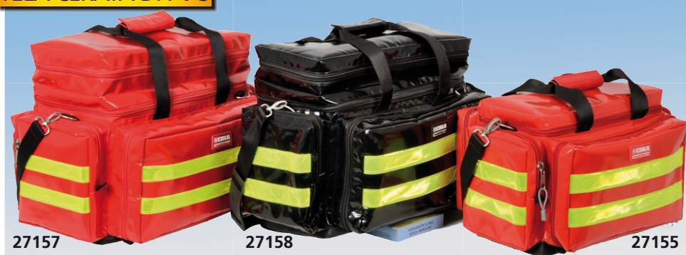
27157 27158 27155 Ampia tasca superiore e tracolle incluse con le borse medie