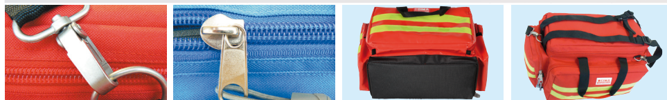
Anello di sicurezza metallico Zip 10 mm Fondo in gomma con piedini Tracolle