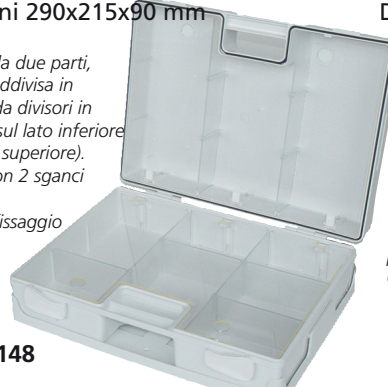
10 anelli elastici piccoli e 2 grandi 6 scomparti