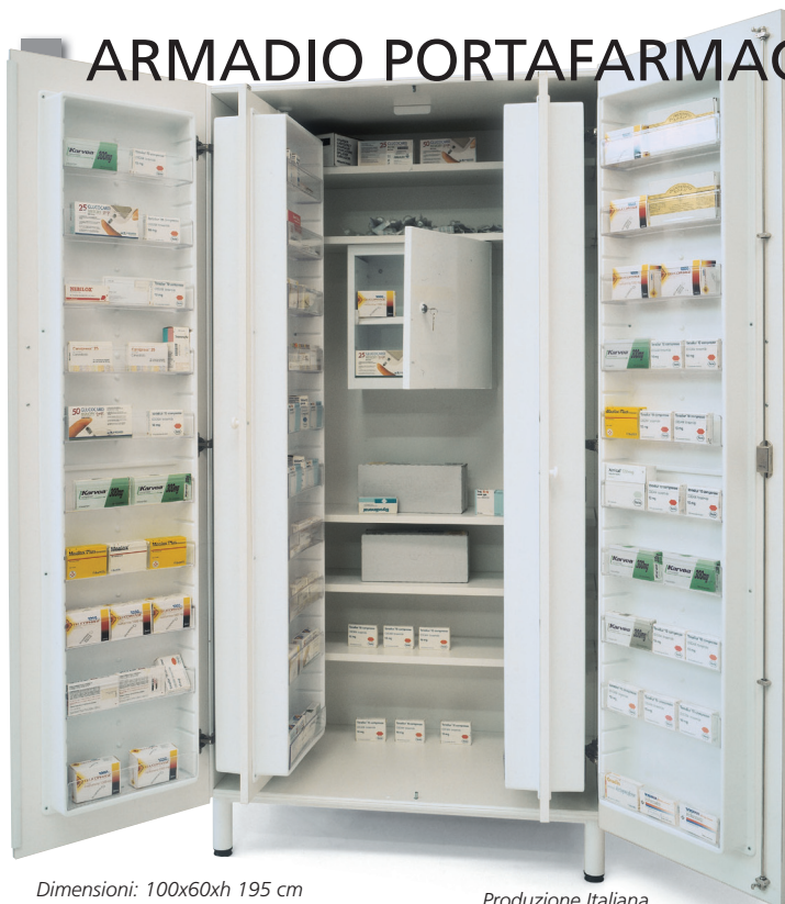
Dimensioni: 100x60xh 195 cm