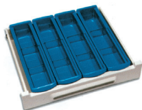
4 x 27498